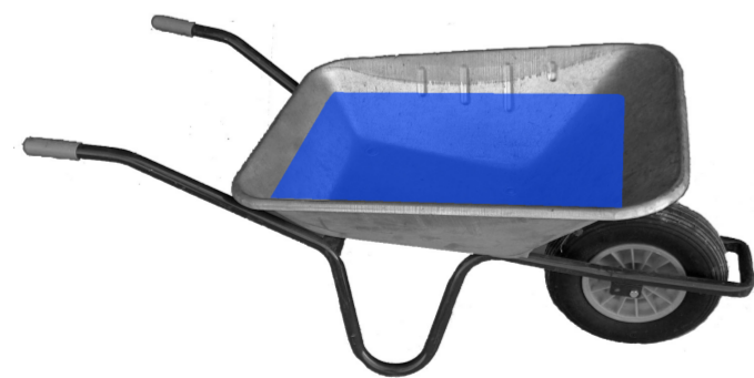
Schubkarren werden zu Tischen

Bauwesten, Baumützen, Bultaschen und Arbeitshandschuhe machen die Freiraum-Bauarbeiter sichtbar. Sie sind in anderen Farben mit dem gleichen poolbar-“Firmen“-Schriftzug und Logo in der Materialausgabe käuflich zu erwerben und tragen als alltagsnützliche Objekte den Gedanken der Freiraum-Baustelle räumlich und zeitlich hinaus und weiter.